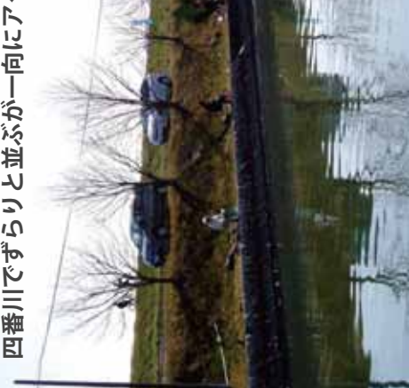
四番川でずらりと並ぶが一向にア