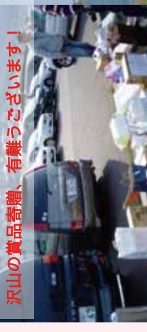
沢山の賞品奇贈、有難うございます!