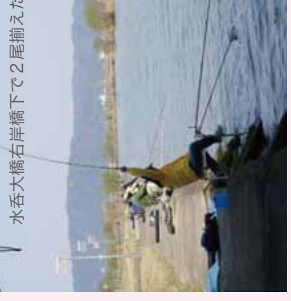
水呑大橋右岸橋下で2尾揃えた