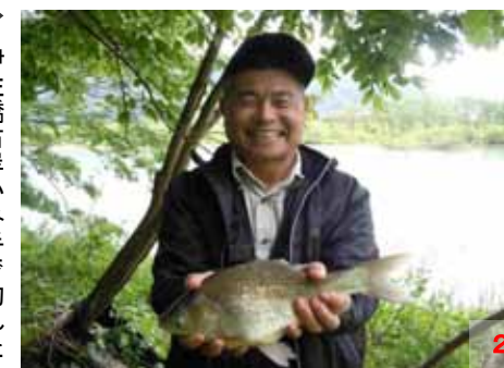
伊佐橋右岸かみ手で釣れたヘラを持ち、にこやかな稲森会長。