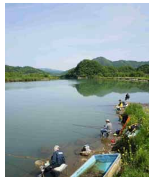
伊佐橋上小田橋間、右岸スロープ付近は足場が良い