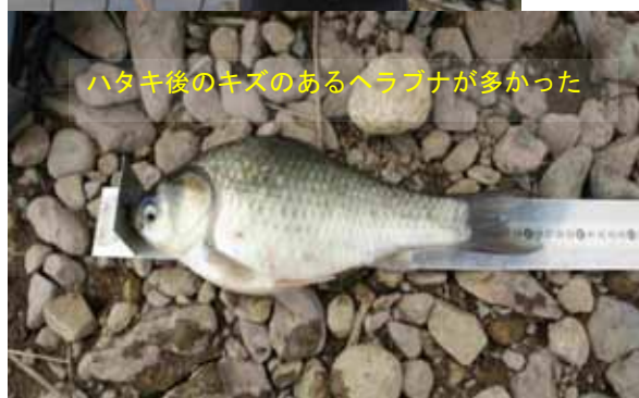
ハタキ後のキズのあるヘラブナが多かった

しっかりしたアタリで尺半マブ。結局、釣れたのは3枚だけで終了。いつもと違い、かなり手強い円山川でした。